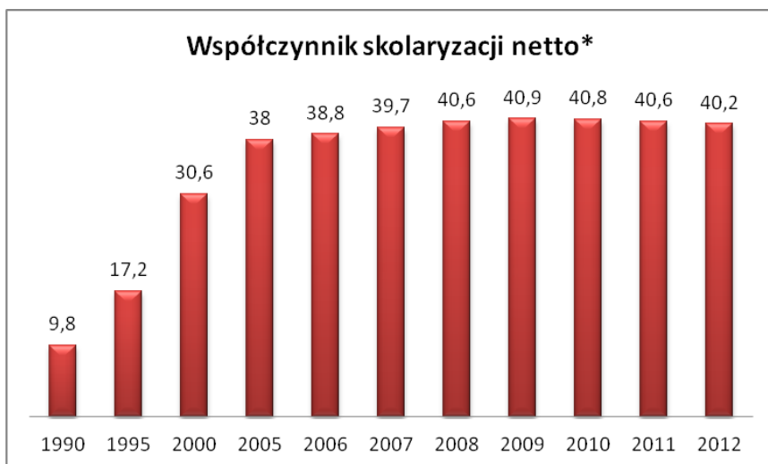
Wykres 2. Współczynnik skolaryzacji netto w szkolnictwie wyższym w Polsce w latach 1990-2012

Zmianę liczby studentów w Polsce najlepiej obrazuje poniższy wykres.