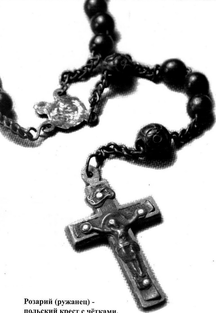
Розарий (ружанец) - польский крест с чётками. XIX в. (6392 ОФ)