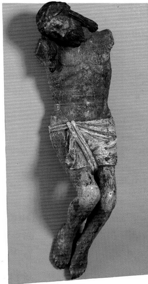
Деталь скульптурного изображения распятия Христа. Дерево. XIX в. (11085 ОФ)