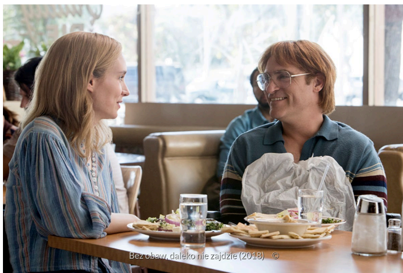
Kadr z filmu Bez obaw, daleko nie zajdzie