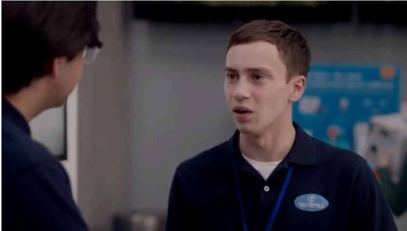
Kadr z filmu Atypowy