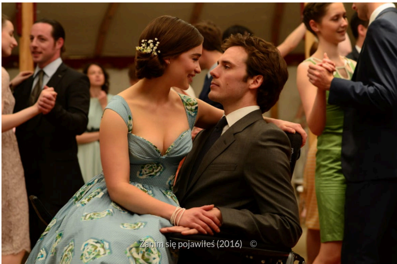
Kadr z filmu Zanim się pojawiłeś