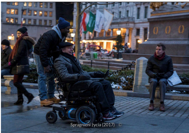
Kadr z filmu Spragnieni życia