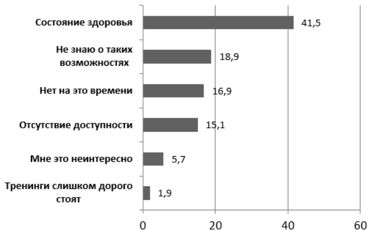
Рис. 1. Причины неучастия людей с инвалидностью в образовательных Программах* (результаты анкетного опроса среди людей с инвалидностью (n=100);* респонденты имели возможность выбрать несколько вариантов ответа

опрошенных. Ожидают от обучения получить возможность быть кому-то полезным и помогать 25,7%. Никто из респондентов не ставит целью получить славу и признание (0%) (Рис. 2).