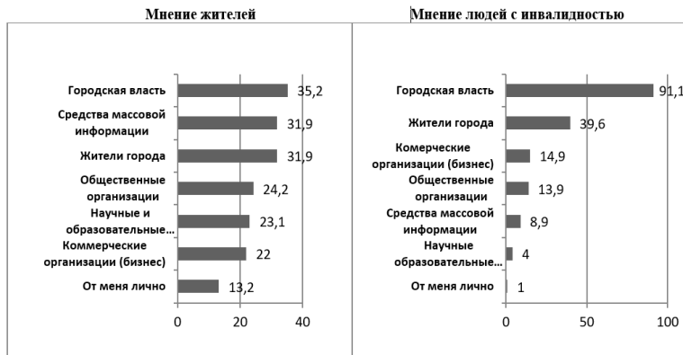
Рис. 5. Уровень зависимости решения проблем города от различных общественных институтов и граждан* (результаты анкетного опроса среди жителей города (n=100) и среди людей с инвалидностью (n=100))

На рисунках 1-4 отображены лишь некоторые результаты комплексного исследования, которые подтвердили гипотезу о недостаточном уровне гражданской активности людей с инвалидностью и о необходимости системы работы для развития гражданской активности. Внешними причинами недостаточного уровня гражданской активности людей с инвалидностью являются: отсутствие городских образовательных Программ для людей с инвалидностью. Фактически действуют несколько ежегодных Программ поддержки людей с инвалидностью, но они направлены, в основном, на оказание медицинской и реабилитационной помощи; отсутствие образовательных Программ для людей с инвалидностью в содержании работы общественных организаций; низкая представленность людей с инвалидностью в общественных организациях города, что демонстрирует их недостаточную социальную активность и неосведомленность о деятельности таких организаций; представленность в общественных организациях людей с инвалидностью прежде всего – большинством людей третьего (старшего) возраста; низкая представленность людей с инвалидностью среди студенческой молодежи от 0 до 4% от общего количества; недостаточность в местных средствах массовой информации публикаций о жизни людей с инвалидностью, преодолении трудностей, их достижениях, как примеров проявления