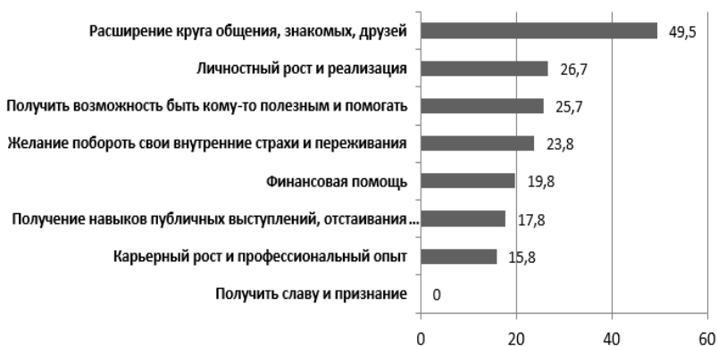
Рис. 2. Цели участия людей с инвалидностью в образовательных Программах* (результаты анкетного опроса среди людей с инвалидностью (n=100) * респонденты имели возможность выбрать несколько вариантов ответа