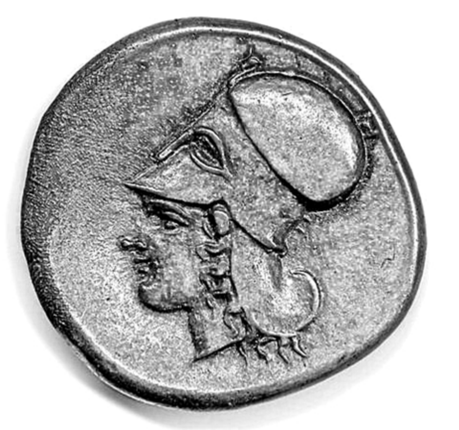
Fig.3. Hełm typu korynckiego; British Museum inv. no. 1918,0204.127. (rys. K. Maksymiuk)

Ten hełm ukazany jest na monecie ze srebra, wybitej w Koryncie około 415-387 r. p.n.e. Na monecie jest głowa Ateny w hełmie korynckim, który posiada dużą ochronę karku, ale także chroni całą twarz posiadając napoliczniki oraz ochronę nosa, a także dwie małe wizury. Hełm nie jestw całości założony, a jedynie położony na czole.