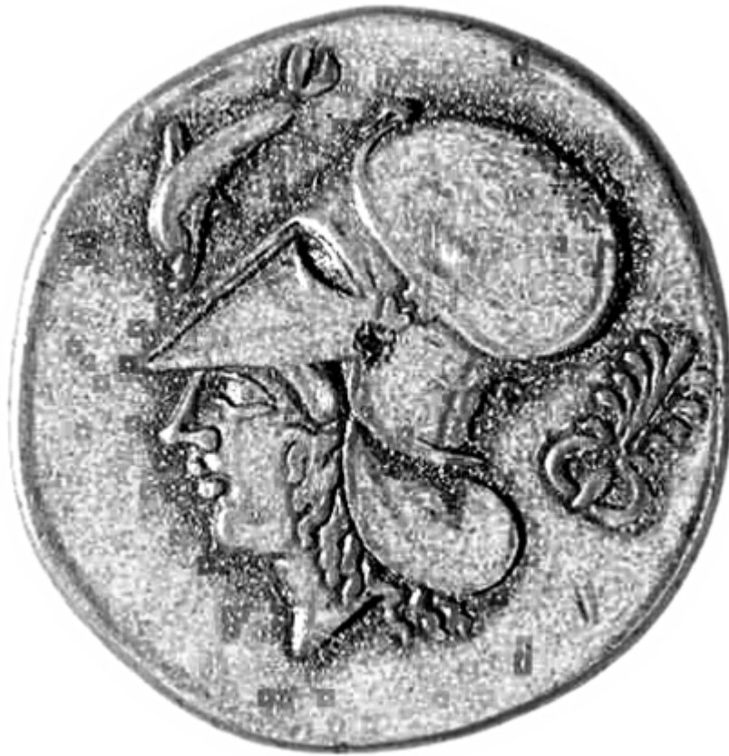
Fig.4. Hełm typu korynckiego; British Museum inv. no. 1869,0709.17. (rys. K. Maksymiuk)

Źródłem, które teraz omówię jest moneta ze srebra, którą wybito na Peloponezie w mieście Koryncie. Monetę tę datuje się na 415-387 r. p.n.e. Pallas nosi hełm koryncki. Hełm ten chroni większość twarzy użytkownika zostawiając miejsce na usta oraz oczy. Między dwoma napolicznikami umieszczona jest ochrona nosa. Posiada on także lekko wystającą do tyłu ochronę karku. Egzemplarz ukazany na monecie nie posiada żadnych zdobień, także często pokazywanej na monetach kresty.