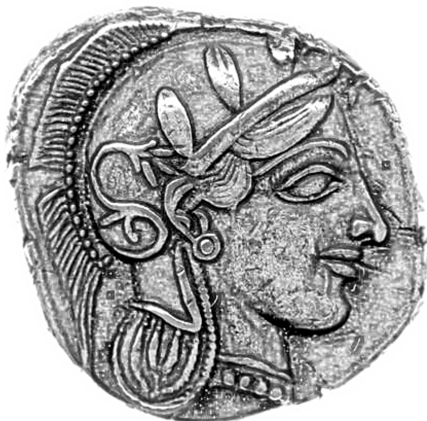
Fig.8. Hełm typu attyckiego; British Museum inv. no. 1922,1102.1. (rys. K. Maksymiuk)

Hełm ten został przedstawiony na srebrnej monecie wybitej w Atenach, a datowanej na 420 r., a znaleziona została w Beni Hasan. Hełm, który nosi Atena jest typu attyckiego nie posiada on żadnej ochrony twarzy, a jedynie ochronę karku. Jest to hełm z krestą, który został ozdobiony w liście oliwne.