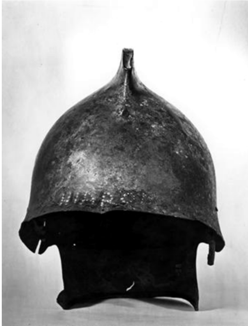
Fig.5. Hełm typu trackiego; British Museum inv. no. 1927,1011.1

Po wojnach grecko-perskich, Grecy powoli przekształcali taktykę walki, w której z ciężkozbrojnych jednostek przechodzą do lekkiej piechoty, która nie nosiła żadnego pancerza oprócz małej tarczy i hełmu. Hełm ten pojawił się w tym okresie czyli około 5 w.p.n.e. jednakże nie był on popularny do następnego wieku, gdzie został spopularyzowany dopiero przez Filipa II 9 .