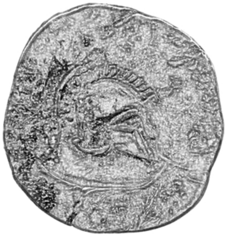
Fig.2. Hełm typu korynckiego; British Museum inv. no. RPK,p68C.3.Aca. (rys. K. Maksymiuk)

został odnaleziony w mieście. Hełm ten posiada dosyć charakterystyczny wygląd. Zakrywa on całą twarz, a wyposażony jest on w dwa otwory na oczy o łukowatym kształcie przedzielone ochroną nosa, natomiast policzki chronią dwa płyty metalu. Hełm nie posiada specjalnych zdobień oprócz wygiętej blachy na płacie czołowym. Służy to tylko walorom artystycznym i nie ma żadnego realnego zastosowania bojowego. Możliwe, że było to spowodowane materiałem, z którego był wytworzony (brąz).