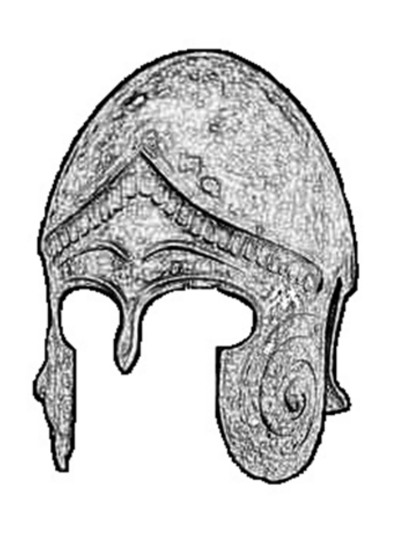
Fig.9. Hełm typu chalcydyjskiego; British Museum inv. no. 1919,1119.6. (rys. K. Maksymiuk)

Jest to hełm typu chalcydyjskiego wykonany z brązu, a datowany na lata 450-400 p.n.e. Nie posiada żadnych ruchomych elementów, wszystkie partie ochronne są jednolite. Posiada on otwory na uszy, a także twarz. Widoczne są duże otwory na oczy, oraz małej wielkości ochrona nosa. Większość twarzy użytkownika była odsłonięta, ma on także ochronę karku.. Na napolicznikach wygrawerowane są koźle rogi. Wygrawerowane są również brwi, a nad nimi są pewne płyty ułożone obok siebie.