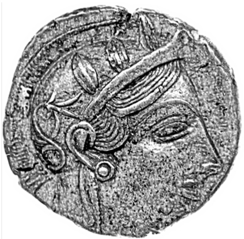
Fig.7. Hełm typu attyckiego; British Museum inv. no. 1948,0506.4. (rys. K. Maksymiuk)

Jest to hełm typu attyckiego, który datuje się na około 500 r. p.n.e. Wykonany został z brązu, a odnaleziony prawdopodobnie w Atenach. Jest to typowy przedstawiciel attyckich hełmów, z charakterystycznym brakiem osłony twarzy. Posiada on napoliczniki, które były ruchome, przymocowane za pomocą prostego kawałka metalu. Również jest ciekawy otwór na uszy, który z pewnością pozwalał łatwiej usłyszeć rozkazy na polu bitwy. Napoliczniki zostały przyłączone do hełmu. Jeśli chodzi o artystyczne walory hełmu to zostały w nim wygrawerowane faliste wzory. Jednakże najważniejszym elementem hełmu jest wysokiej jakości głowa satyra wykonana ze srebra.