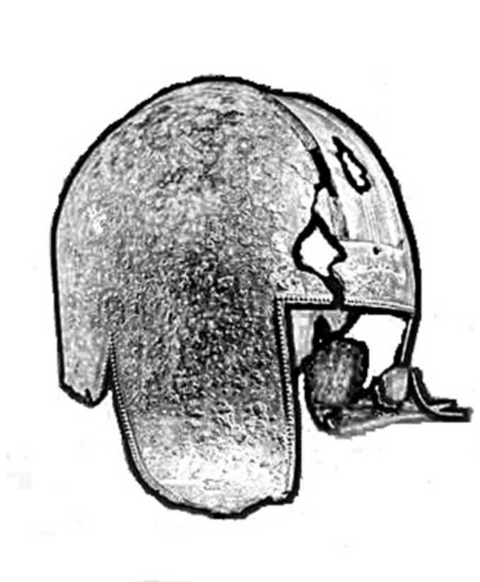
Fig.10. Hełm typu Iliryjskiego; British Museum inv. no. 1914,0408.1. (rys. K. Maksymiuk)

Hełm Iliryjski, cieszył się największą popularnością w Macedonii i Ilirii. Wynaleziony został na Peloponezie i szybko zdobył popularność wśród Greków. Kształtem podobny był do wczesnych hełmów z epoki brązu. Krył on całą głowę, policzki, a także część gardła, jednakże nie osłaniał on twarzy. Wykonany był z dwóch kawałków metalu, które przecinały hełm w połowie 14 . Z tych względów nie był on wytrzymały, a brak osłony twarzy był problemem w razie bliskiej potyczki, dodając do tego naturę greckich bitew, gdzie nie było trudno o taką sytuację hełm ten zniknął w 5 w. p.n.e. Co ciekawe hełm ten był najpopularniejszy wśród Iliryjczyków oraz Macedończyków. Północne społeczności preferowały lekką piechotę, luźne formacje oraz kawalerię, które dla lepszej widoczności potrzebowały otwartych hełmów 15 .