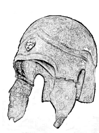
Fig.6. Hełm typu attyckiego; British Museum inv. no. 1883,1208.3. (rys. K. Maksymiuk)

Okolo 600 r. p.n.e. powstał hełm wczesnoattycki, którego nie można już było przesuwac na tył głowy. Nosal był mniejszy, a napoliczniki były ruchome. Podobny do niego był hełm chalijski jednakże jego napoliczniki były sztywne i integralne z resztą hełmu 10 . Hełm attycki nie posiadał żadnej ochrony twarzy, hełm ten charakteryzował się również otworami na uszy, oraz napolicznikami, które były nitowane do hełmu 11 .