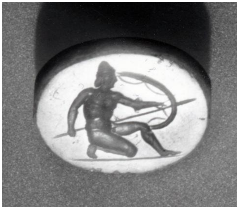
Fig.11. Helm typu pylos; British Museum inv. no. 1902,0618.1, © The Trustees of the British Museum

Istniały również hełmy tanie w wykonaniu, takim hełmem był Pylos, który nie posiadał żadnej ochrony twarzy, karku, ani policzków. Był to hełm o prostej budowie w kształcie czapy i był używany przez biedniejszych Greków, np. Zamieszkałych na Półwyspie Peloponeskim 16 . Miał kształt żółdza i mocowany był na głowie przy pomocy rzemieni 17 .