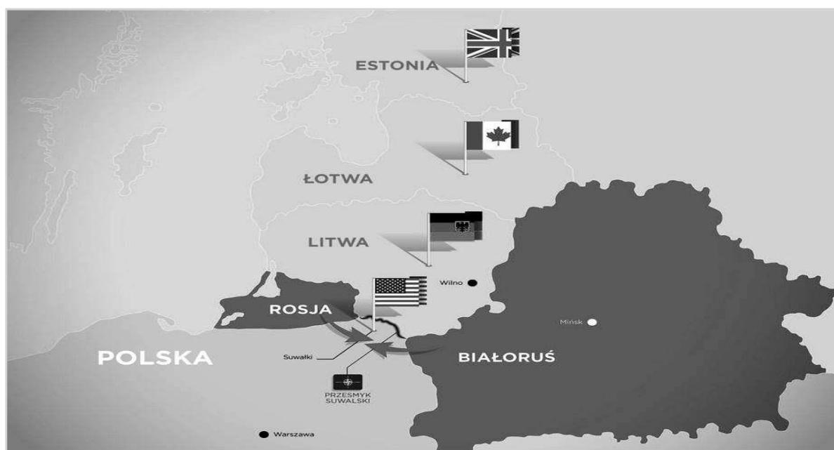
Mapa nr 2. Przesmyk suwalski

Obawą jest to, że NATO mogłoby nie zdążyć zareagować gdyby Rosja zaatakowała kraje bałtyckie. Prawdopodobny atak na przesmyk suwalski rozpocząłby się pod Grodnem, następnie przez powiat sokólski w kierunku na północ od Białegostoku. Rosyjskie jednostki mogłyby napotkać trudności w przedostaniu się dalej na zachód przy linii kolejowej Białystok-Augustów, ponieważ rozpościera się tu pas mokradeł i rzeka Brzozówka. Uciekając na południe również napotkałyby na nadrzeczne rozlewiska, bagna i torfowiska Kotliny Biebrzańskiej i rzeki Biebrzy od północnego zachodu. Atak ze strony polskiej mógłby nadejść z Puszczy Knyszyńskiej, z rejonu Czarnej Białostockiej i Supraśla, który broni dostępu do Białegostoku od północy. Byłoby to jednak ciężkie przy potencjalnie rozległym bombardowaniu lotniczym i artyleryjskim. Także warunki terenowe znacząco utrudniłyby atak. Zatem liczebność nawet najlepszych jednostek nie powinna być przeceniana. Gdyby Rosja wydzieliła zbyt dużą ilość wojsk do inwazji na przesmyk suwalski, mogłoby to doprowadzić do kolizji między nimi na konkretnym odcinku frontu 26 . Obrona państw bałtyckich wymaga odpowiedniego przygotowania. Poniższa mapa przedstawia obszar „przesmyku suwalskiego”.