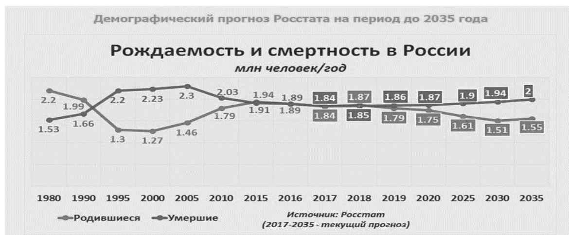
Таблица 2. Демографический прогноз Росстата на период до 2035 года, https://rosstat.gov.ru/folder/12781 (30.11.2020).

В данное время в России, в связи с так называемой «демографической катастрофой», государство всячески поощряет и стимулирует рождение детей, ведь рождаемость падает и текущий прогноз Росстата России до 2035 г. говорит о том, что рождаемость будет продолжать падать, а смертность расти (табл. 2) Российское государство прилагает максимальные усилия для того, чтобы повысить рождаемость и помочь молодым родителям в материальном и моральном плане. Помимо прочих, это такие меры, как единовременные пособия по рождению ребенка, пособия до 1,5 лет, детские сады, материнский капитал, школы будущих родителей. Последнее касается только периода, как правильно вести себя во время беременности, как проходят роды, как ухаживать за ребенком в первые полгода.