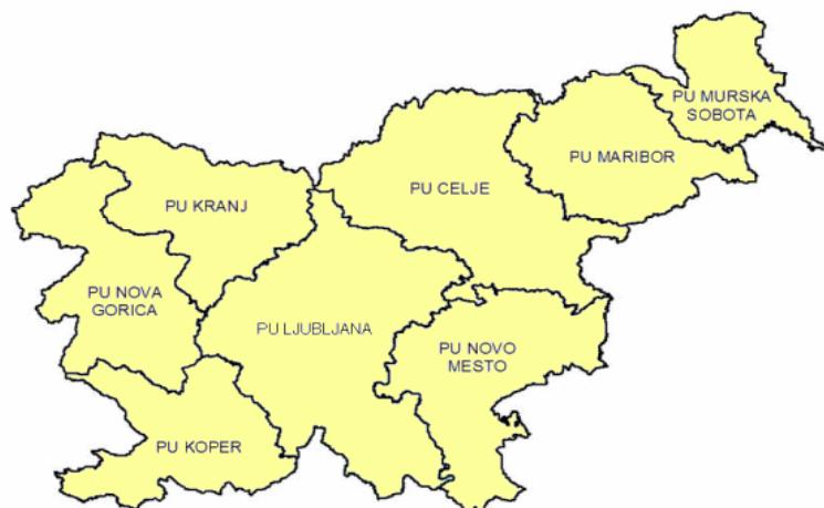
Rysunek 1. Podział terytorialny słoweńskich dyrekcji policji

Na poziomie regionalnym funkcjonuje osiem dyrekcji policji, którym na szczeblu lokalnym podlega łącznie 107 posterunków. Poszczególne dyrekcje rozmieszczone są na terytorium całego państwa, w następujących miejscowościach: Lublana (21 posterunków), Murska Sobota (8), Maribor (17), Celje (16), Novo Mesto (13), Kranj (10), Nova Gorica (8) i Koper (14) 8 . Rozmieszczenie i zasięg terytorialny działania poszczególnych regionalnych dyrekcji policji prezentuje rysunek 1.