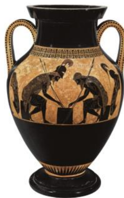
Рис. 4. Ахилл и Аякс, играющие в кости (инв. номер 16757)

В перечне тех, кто «учен уроками Хирона» (Pind. Pyth.4), Ахилл, несомненно, занимал достойное место. Хирон успешно реализовал с ним освоение того, что мы сейчас назвали бы вариативным учебным планом с мощной воспитательной составляющей. Как все герои, Ахиллес обучался гораздо быстрее обычных детей, хотя у кентавра он провел не слишком много времени. Уже в девять лет Фетида, желая уберечь сына от участия в троянской войне, передает Ахиллеса на воспитание Ликомеду (Apollod. Bibl. III.13.8). Участь Хирона-учителя оказалась достаточно плачевной: по легенде, он умер от руки своего ученика Геракла. Псевдо-Аполлдор сообщает о том, что Геракл сделал это непреднамеренно и сильно пожалел о случившемся: «Целясь из лука в кентавров, столпившихся вокруг Хирона, Геракл выпустил стрелу, но она, пронзив плечо кентавра Элата, засела в колене Хирона. Глубоко огорченный этим, Геракл подбежал и, вытащив стрелу, приложил к ране лекарство, которое дал ему Хирон. Но рана была неизлечимой...» 12 (Apollod. Bibl. II.5.4).