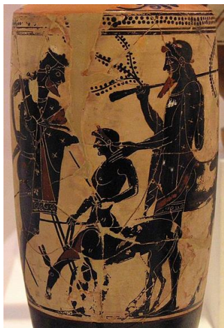
Рис. 1. Пелей доверяет сына Ахиллеса кентавру Хирону (инв. номер 550)

На чернофигурной амфоре (500-480 гг. до н.э.) из Британского музея изображен мальчик, сидящий на кентавре (предположительно, Ахиллес и Хирон) (Рис. 2).