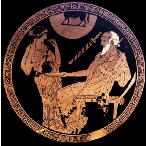
Рис. 5. Брисеида и Феникс

присущую юности 14 . Функция престарелого Феникса в этом эпизоде наставить ученика, который формально уже не находится в этом статусе 15 . На краснофигурной чаше (ок. 490 г. до н.э.) из Лувра изображена Брисеида и Феникс (Рис.5).