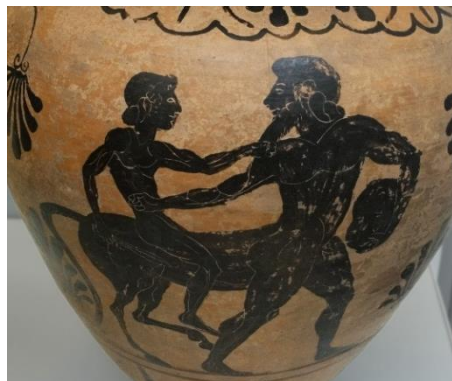
Рис. 2. Ахиллес и Хирон (предположительно)

В античной педагогической традиции Хирон был наставником, известным как своим мастерством, так и своими учениками 6 , каждому из которых кроме «общей программы» (включающей бег, схватку с мечом, стрельбу из лука), он подбирал наиболее подходящую науку. Пиндар, например, выделяет среди учеников Хирона предводителя